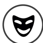
JEUX DE ROLE