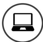
TRAINING EN LIGNE