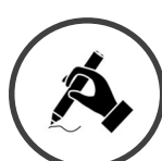
EXERCICES & MISE EN APPLICATION