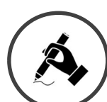
EXERCICES & MISE EN APPLICATION